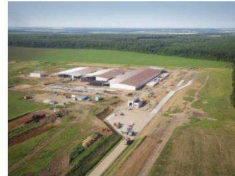
Птахофабрика "Вінницький бройлер"