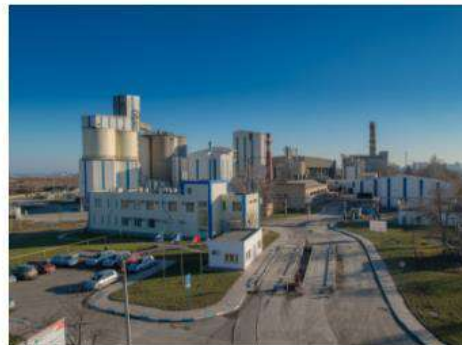
Одеський цементний завод