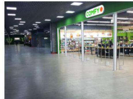
Виробничий цех під торгові приміщення