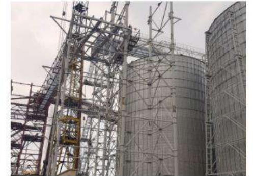
Зерновий термінал в Чорноморському порту