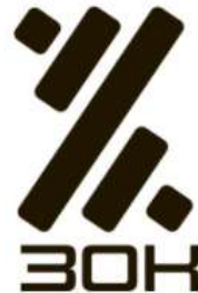
ЖИТОМИРСЬКИЙ ЗАВОД ОГОРОЖУВАЛЬНИХ КОНСТРУКЦІЙ