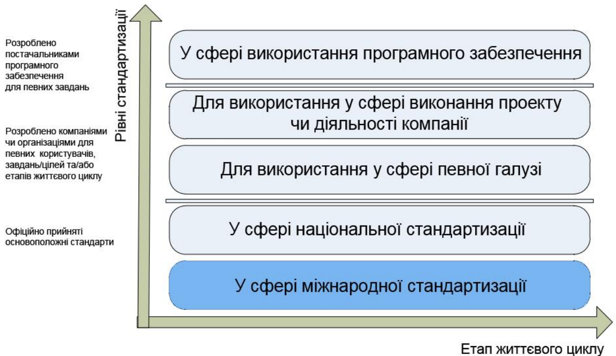
Рисунок 1 – Рівні застосування стандартів BIM

3) сприяння використанню положень офіційних договорів, які містять посилання на стандарти.